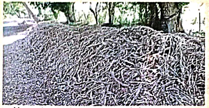
हळद बेणे झाडाखाली सावली असलेल्या थंड ठिकाणी ढीग करून ठेवावेत.