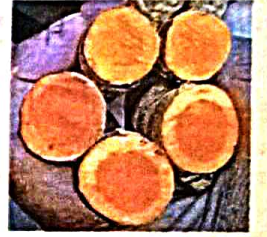
रसरशीत निरोगी बेणे

हळद हे महत्त्वाचे तसेच बहुउपयोगी मसाला पीक म्हणून प्रचलित आहे. राज्यातील एकूण हवामानाचा विचार केला असता हळद पीक उत्तमरीत्या घेता येते. निर्यातक्षम व गुणवत्तापूर्ण हळदीच्या उत्पादनासाठी पूर्वमशागतीपासून हळद प्रक्रिया, हळद बेणे साठवणुकीपर्यंत पिकाचे व्यवस्थापन काळजीपूर्वक करणे गरजेचे असते.